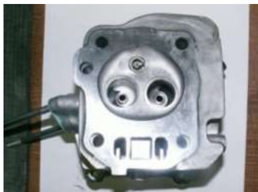
Фото 11-3.2. Вид камеры сгорания.