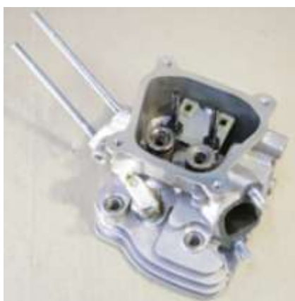
Фото 10-3.3. Вид со стороны выпуска