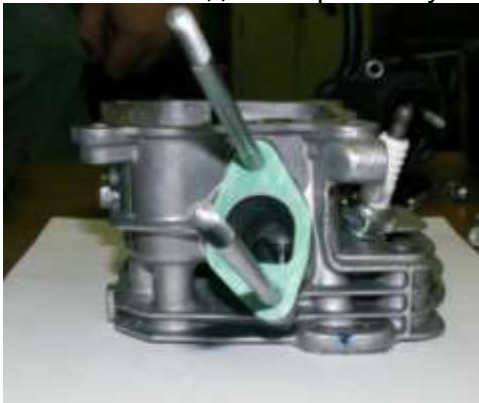
Фото 11-3.1 Вид со стороны впуска.