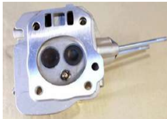
Фото 10-3.2. Вид камеры сгорания.