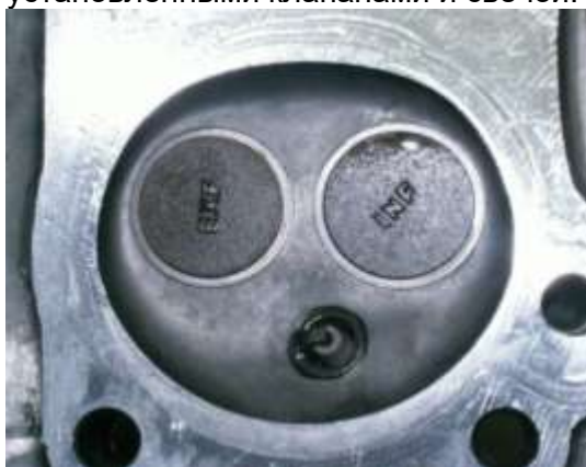
Фото 11.3-6. Камера сгорания с установленными клапанами и свечой.