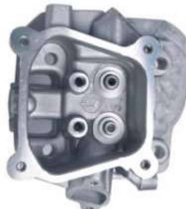
Фото 10-3.4. Вид сверху. 4 болта.