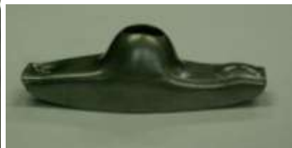
Фото 11-3.5. Коромысло демонтированное.