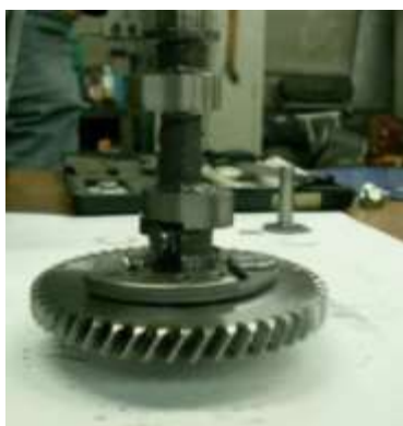
Фото.11-4.1. Демонтированный распредвал. Вид сбоку.