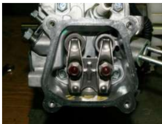
Фото 11-3.4. Привод клапанов. Вид сверху со стороны клапанной крышки.