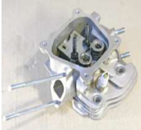
Фото 10-3.1 Вид сверху со стороны впуска.