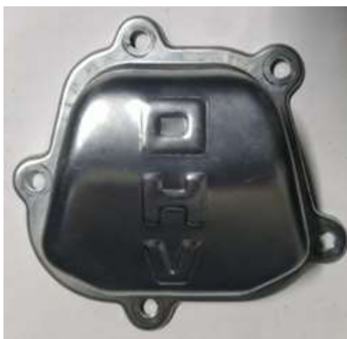
Фото 10-3.5. Клапанная крышка. 5 болтов.