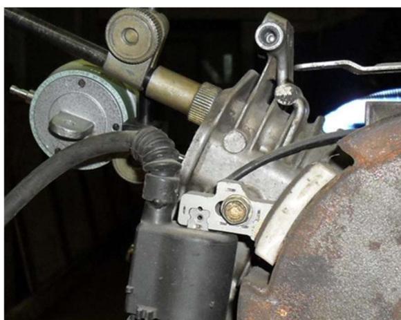
Фото 11-6.2. Конец замера.